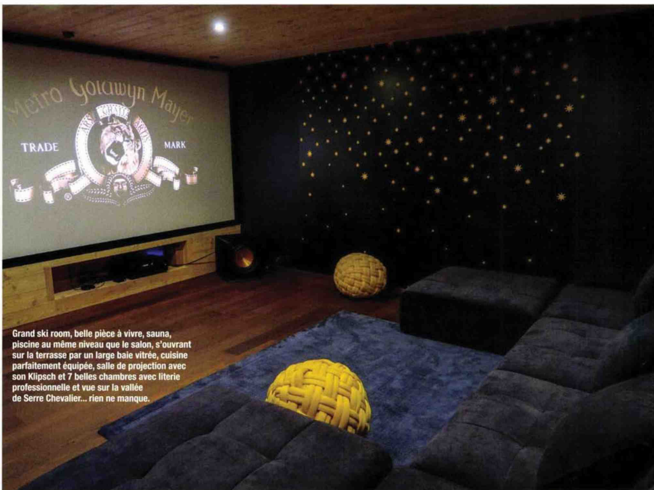
Grand ski room, belle pièce à vivre, sauna, piscine au même niveau que le salon, s'ouvrant sur la terrasse par un large baie vitrée, cuisine parfaitement équipée, salle de projection avec son Klipsch et 7 belles chambres avec literie professionnelle et vue sur la vallée de Serre Chevalier... rien ne manque.