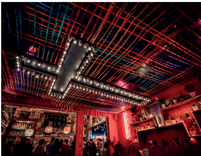
LA MEZCALERIA PARIS

Pour aller plus loin dans cette remise en cause de nos modes de consommation, le dernier né de Machefert Group, intitulé REHAB souhaite s'emparer de cette tendance qui valorise le « spirit free » (sans alcool) et le « low alcohol » tout en tirant avantage de l'assouplissement de la législation sur l'utilisation du CBD. Le CBD constitue l'un des composants du chanvre aux propriétés relaxantes mais non psychoactives contrairement au THC. Aujourd'hui, face à une société hyperconnectée où le stress est omniprésent, les consommateurs sont en quête de bien-être, de décompression sans compromettre leur santé. REHAB s'inscrit dans cette tendance et fait figure d'exemple sur son secteur en promouvant des alternatives saines à l'alcool et en inventant les « Hocktails », comprenez high-cocktails – des préparations « spirit free » ou « low ABV » à base de CBD, produisant certains effets souhaités de l'alcool sans les inconvénients.