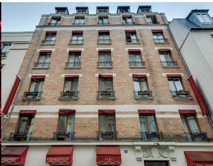
PAVILLON COURCELLES PARC MONCEAU