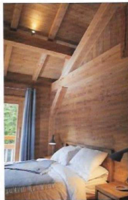
De jolies lampes AJ Poulsen jouent une rupture légère avec les ambiances. Le lit en teck comme les tables de chevet en noyer (Raff Furniture) restent sur des notes boisées.