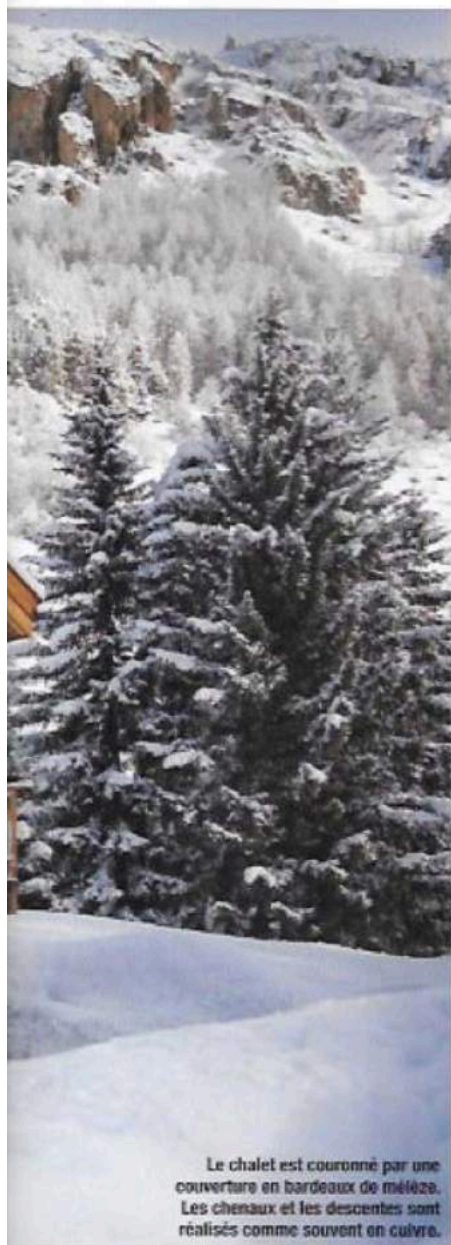
Le chalet est couronné par une couverture en bardeaux de mélèze. Les chénaux et les descentes sont réalisés comme souvent en cuivre.

ski, et qui est tombé amoureux de la vallée de Semnoz-Chevalier. Ce fut une belle expérience avec un client qui nous a fait une confiance totale. Un vrai plaisir. » Amoureux des belles choses, le propriétaire ne voulait pas pour autant une composition démesurée et cinquante. « Souvent les Anglo-saxons ont cette envie d'un lieu pratique et fonctionnel », précise Anne Bayrou. Mais cette sobriété voulue n'empêche en rien le bien-être, les belles matières et l'élégance. Simplement, les choses ont été faites avec délicatesse et légèreté avec une décoration au raffinement simple et du bois, qui par sa seule présence, magnifie les lieux.