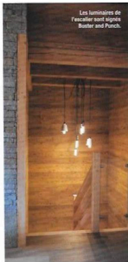
Les luminaires de l'escalier sont signés Buster and Punch.