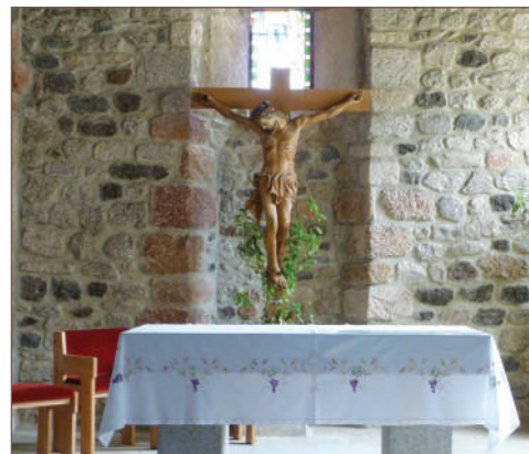
Intérieur de l'église Saint-Julien