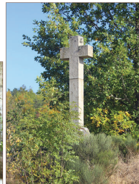
La croix de Brély