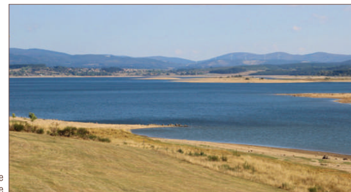
Vue depuis la croix de la Pierre Blanche

• Comité Lozère : www.comitedepartementaldelarandon-nepedestredelozerecdrp48.com