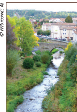
Le Langouyrou, à Langogne