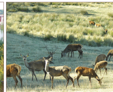
Les cervidés de la ferme de Brugeyrolles