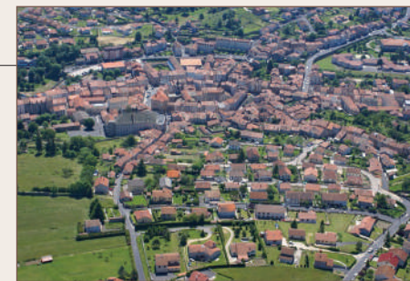
Vue aérienne de Langogne

La situation géographique de cette cité médiévale en fait rapidement un carrefour d'échanges et de négoce, toujours en vigueur. Le 7 avril 2000, Langogne a obtenu le record du monde de la saucisse