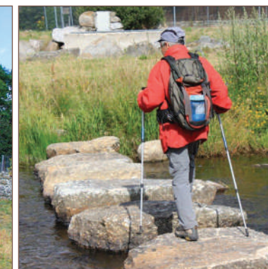
Passage de gué aux Moulins