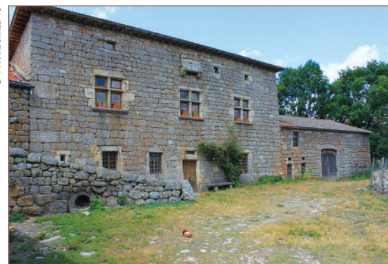
Manoir de Fontfreyde