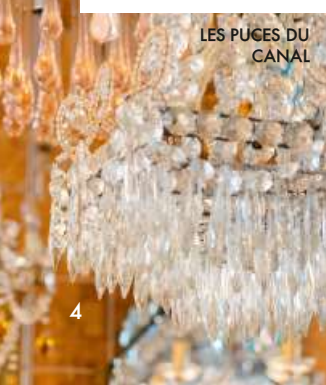
LES PUCES DU CANAL