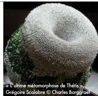
« L'ultime métamorphose de Thétis », Grégoire Scalabre