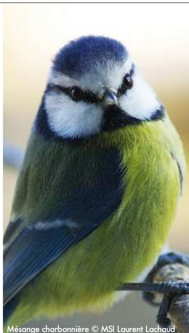
Mésange charbonnière

Jusqu'au 5 novembre. Muséum de Bordeaux, 5, place Bardineau, Bordeaux (33). 05 24 57 65 30. museum-bordeaux.fr . De 2 à 8 €.