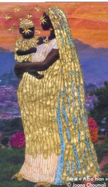
Série « Alba'hian »

Du 1 er juin au 1 er octobre. Point info : place de la Ferronnerie, La Gacilly (56). 02 99 08 68 00. festivalphoto-lagacilly.com . Accès libre.