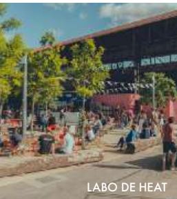
LABO DE HEAT