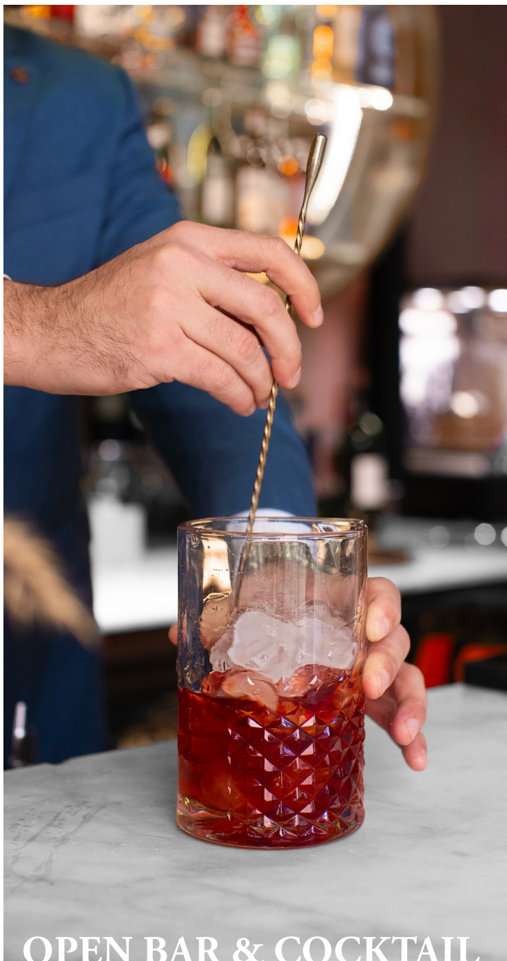
OPEN BAR & COCKTAIL