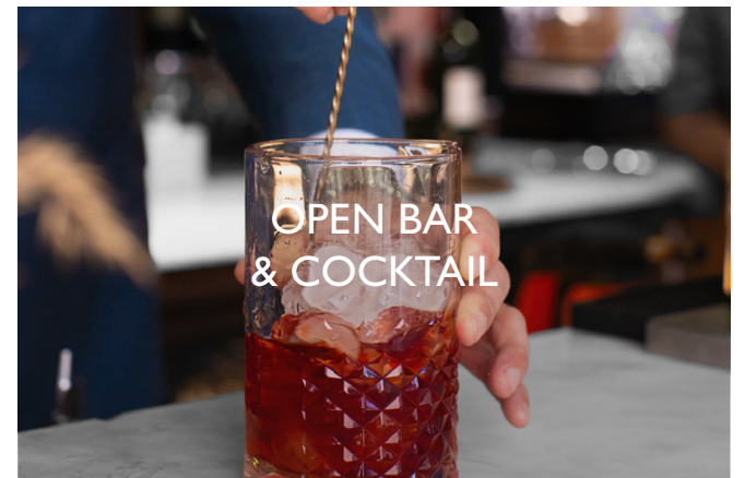
OPEN BAR & COCKTAIL