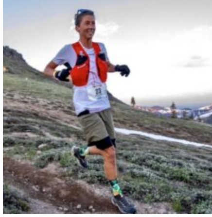
COURTNEY DAUWALTER PULVERISE LE RECORD DE LA WESTERN STATES 100