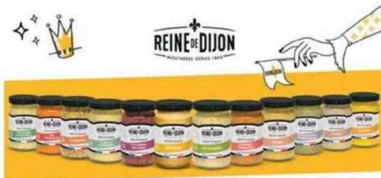
Rempotez ma nouvelle collection de moutardes sans conservateur, aux graines 100% françaises !