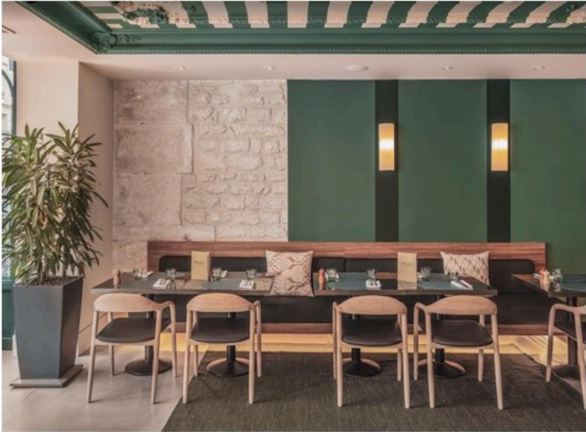
Restaurant Belleval

À la carte ? Les plats sont variés : le poke bowl aux falafels et quinoa rouge est une option végétarienne savoureuse, tandis que le pavé de rumsteck, accompagné de purée maison et d'une poêlée de champignons aux herbes, ravira les amateurs de viande. La pêche du jour, un saumon délicatement rôti le jour de notre visite, est servie avec une purée de pommes de terre et des brocolinis croquants. Côté desserts, le moelleux au chocolat et la crème brûlée font l'unanimité alors que la mousse au Philadelphia, accompagnée d'éclats de pistache, ajoute une légère touche de fraîcheur. Pour les indécis, le café gourmand permet de goûter à un peu de tout.