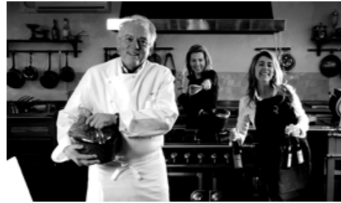
UNE SAGA CULINAIRE : ROSTANG PÈRE ET FILLES.

Cette agence d'architectes a suivi de nombreux projets de renom, avec notamment la rénovation globale de l'Hôtel Ritz, la construction de l'Hôtel Spa Cheval Blanc à Courchevel.