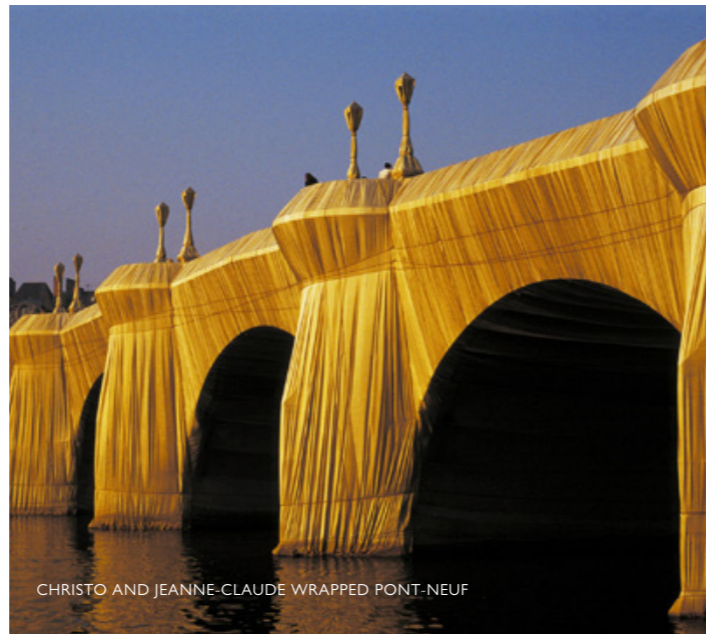
CHRISTO AND JEANNE-CLAUDE WRAPPED PONT-NEUF