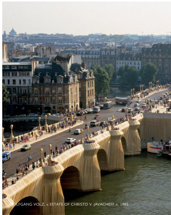
WOLFGANG VOLZ, « ESTATE OF CHRISTO V. JAVACHEFF », 1985