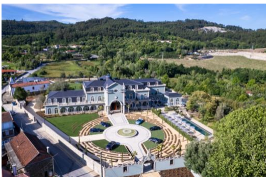
Maison Albar – Amoure (Braga)

C'est ainsi qu'en 2024, Centaurus Hospitality Management a déjà signé deux nouveaux mandats de gestion ; Maison Cassandre (pour le compte du fonds d'investissement NOVAXIA) à Paris, ouvert en février 2024, et Maison Albar - Amoure (pour le compte d'un propriétaire individuel) près de Braga, ouvert en juin 2024. D'autres mandats de gestion sont en cours de signature.