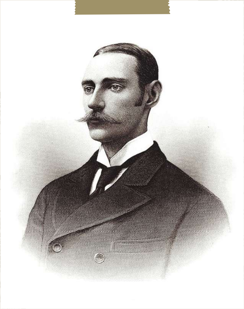
John Jacob Astor IV