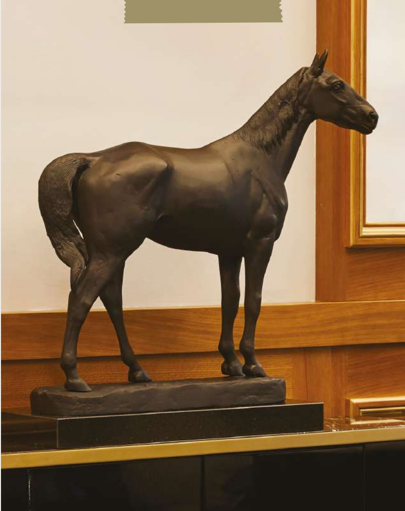
The Original Messenger Horse