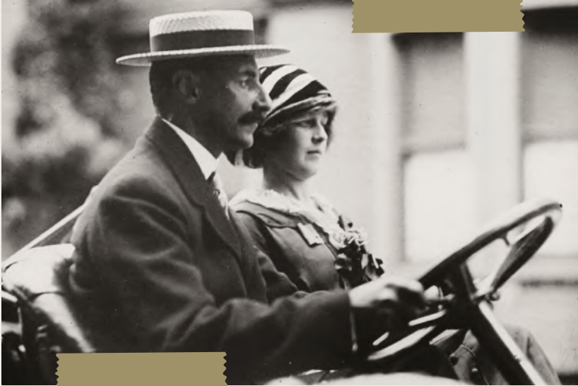
John Jacob Astor et sa seconde épouse, Madeleine. John Jacob Astor and his second wife, Madeleine.