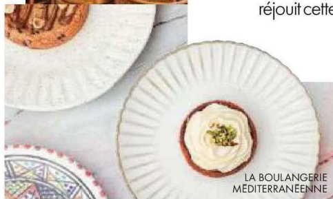
LA BOULANGERIE MÉDITERRANÉENNE