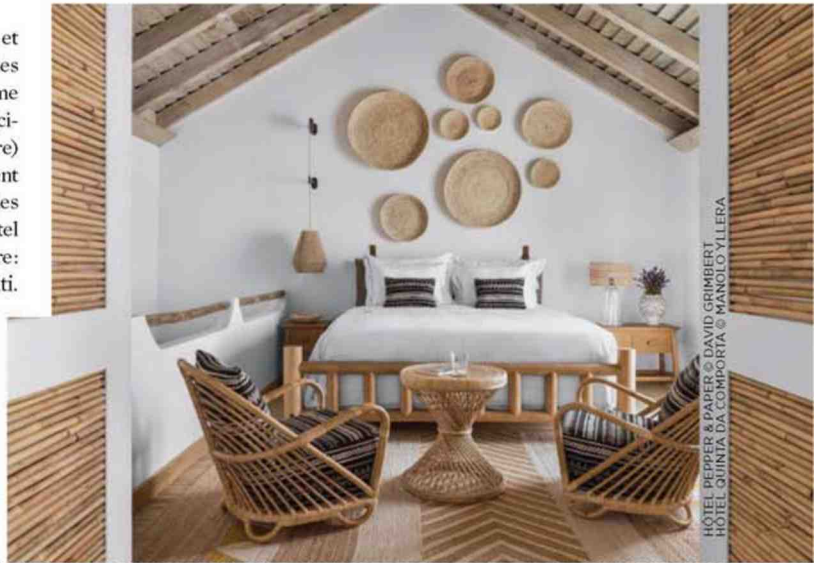
HÔTEL PEPPER & PAPER HÔTEL QUINTA DA COMPORTA

On s'offre une bulle écolo dans laquelle se reposer et surtout déconnecter. Pour y arriver, on privilégie les couleurs minérales et on introduit du végétal comme dans la chambre de l'hôtel Pepper & Paper à Paris (ci-dessus). Bois et fibres naturelles (lin, jute, chanvre) sont incontournables et peuvent habiller entièrement la pièce, du mur au plafond, en passant par le lit, les chevets et les accessoires de déco. Pari réussi à l'hôtel Quinta Da Comporta au Portugal. Un seul mot d'ordre: less is more , pour un retour à l'authenticité garanti.