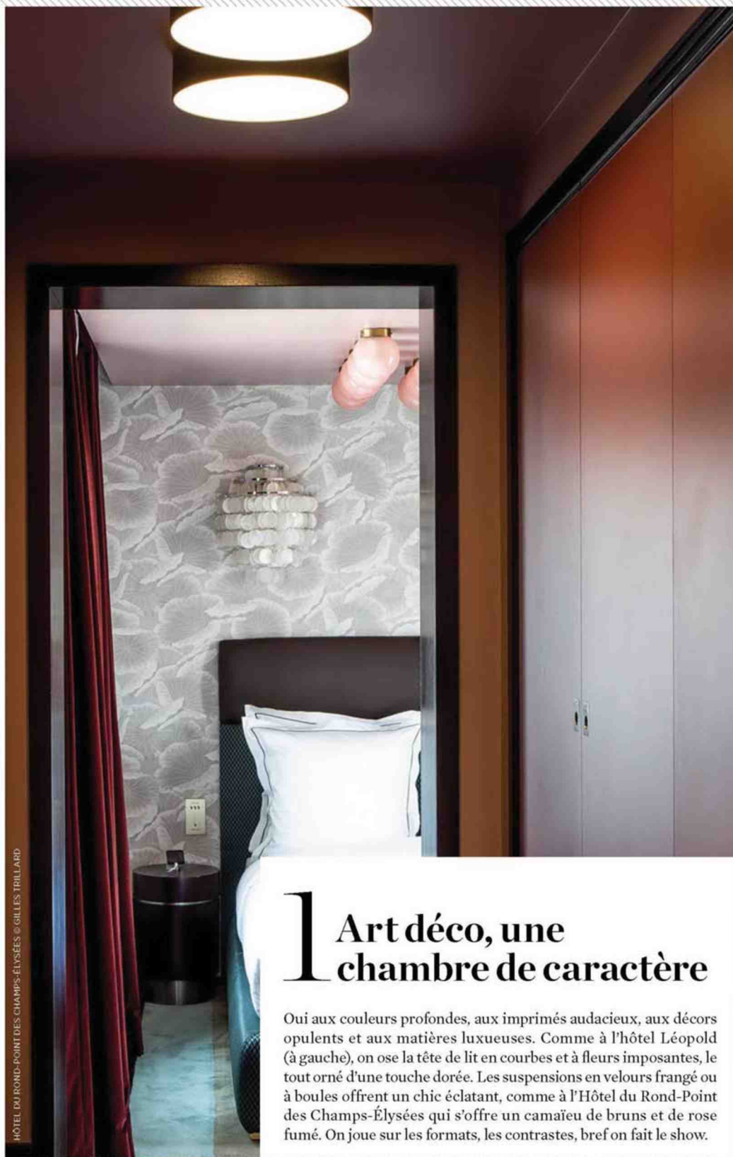
HÔTEL DU ROND-POINT DES CHAMPS-ÉLYSÉES