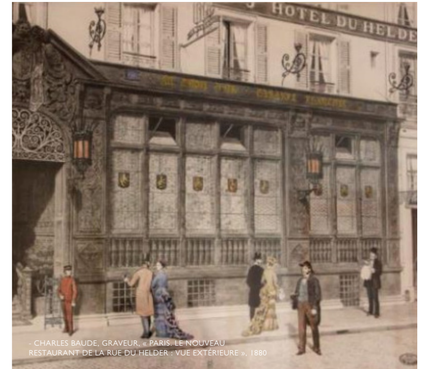
- CHARLES BAUDE, GRAVEUR, « PARIS. LE NOUVEAU RESTAURANT DE LA RUE DU HELDER : VUE EXTÉRIEURE », 1880