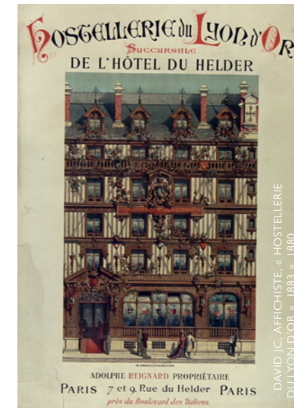
- DAVID J.C. AFFICHISTE, « HOSTELLERIE DU LYON D'OR », 1883 », 1880

« Ce restaurant est unique en son genre et constitue une des merveilles de la capitale de la France. Installé et meublé dans le vrai style de la renaissance, il jouit, parmi les voyageurs de toutes nationalités, d'une très grande réputation pour son confort, son luxe grandiose, son exquisite cuisine et ses vins renommés. Il a été annexé, en 1880, à l'HOTEL DU HELDER, connu dans le monde entier, et où les Appartements et Chambres peuvent être retenus à l'avance par lettre ou dépêche. »