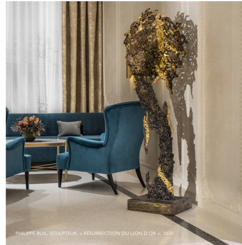
PHILIPPE BUIL, SCULPTEUR, « RÉSURRECTION DU LION D'OR », 2020