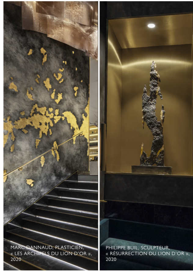
MARC DANNAUD, PLASTICIEN, « LES ARCHIPELS DU LION D'OR », 2020

Cette œuvre est déclinée en 52 tableaux uniques répartis dans les chambres de notre Maison, confiant à chacun de nos hôtes, un de ces archipels.