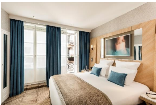
Chambre – Hôtel Louvre Saint-Honoré

Ces deux hôtels parisiens d'une capacité totale de 80 chambres présentent un potentiel de valorisation très attractif : idéalement localisé rue Saint-Honoré dans le 1 er arrondissement , le Louvre Saint-Honoré est situé à 200 mètres à peine de l'entrée du Musée du Louvre et à 400 mètres du jardin du Palais Royal ; le second, le Marais Grands Boulevards, situé dans le 3 ème arrondissement , est un trait d'union entre le passé et l'avenir, élégant boutique-hôtel à la belle façade haussmannienne proposant un cadre unique, comme un voyage dans le temps au cœur d'un Paris en perpétuelle mutation dans le Marais.