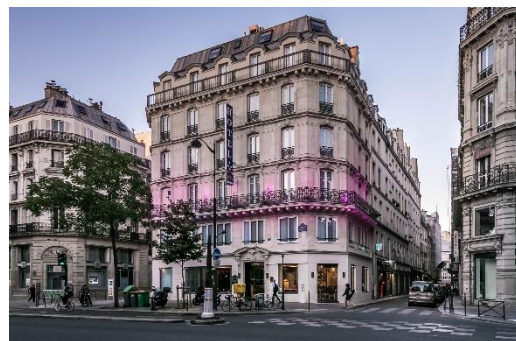
Façade – Hôtel Marais Grands Boulevards