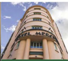
La façade contemporaine de l'hôtel.