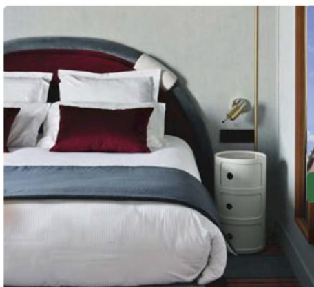
L'hôtel comporte 37 chambres et une suite.