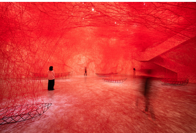
Chiharu Shiota, Uncertain Journey, 2021

LES ÉVÉNEMENTS À NE PAS MANQUER | NOT-TO-MISS EVENTS