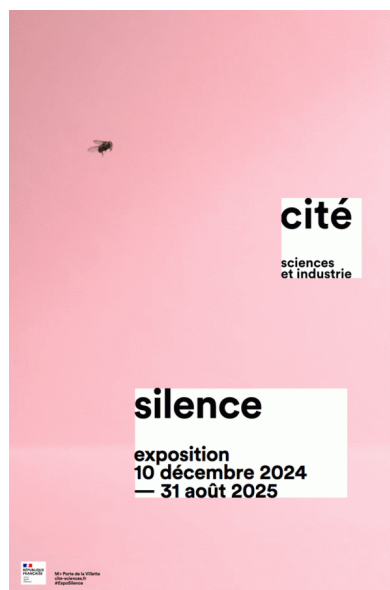
© Cité des Sciences et de l'Industrie