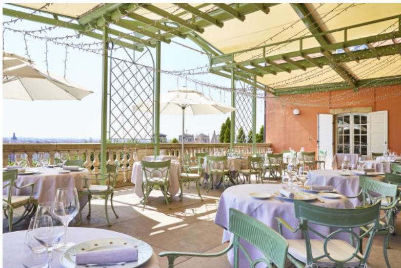
Terrasse de la Villa Florentine

Dominant les toits de la capitale des Gaules depuis la colline de Fourrière, ce Relais & Châteaux est le point de chute idéal pour un apéro romantique les yeux dans les yeux. Sur la terrasse ombragée de cet ancien couvent datant de la Renaissance, on peut se contenter d'un bon verre de vin avant d'aller se gourmander au restau étoilé tenu par le chef David Delsart.