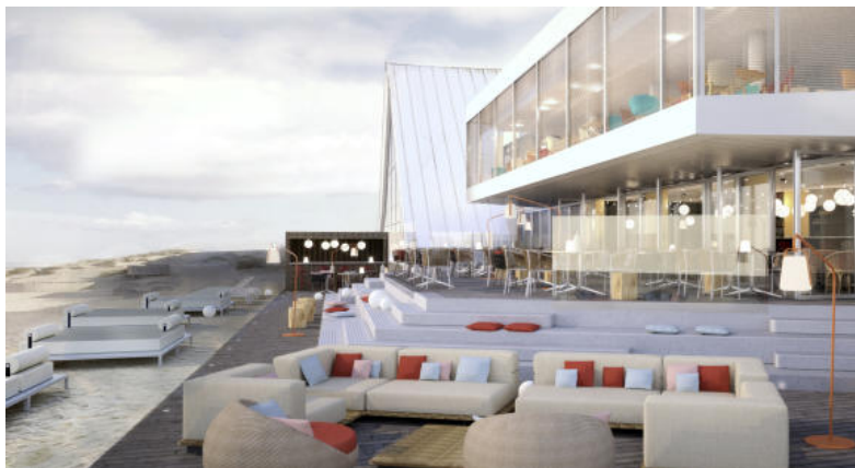
Terrasse de l'hôtel Novotel Le Touquet

au piano, Philippe Moreno, qui travaillait avant aux côtés de Gerald Passédat à Marseille. Prix moyen 60 euros. Mais aussi, de 12 heures à 15 h « La beach house du lac » pour grignoter à partir de 9 euros https://www.lesdomainesdefontenille.com/fr/leshortensiasdulac.html 1 578 Avenue du Tour du Lac. 40150 Soorts-Hossegor - France Tél. : 33 (0) 5 58 43 99 00 Le Touquet : « le Deck » de l' hôtel Thalassa Novotel