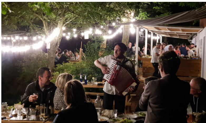
La guinguette au bord de l'eau

Non loin de Lyon : la guinguette au bord de l'eau