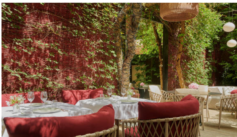
Le Lancaster, Paris

Tout juste rénové par le Studio Jean Phillippe Nuel, l'hôtel Lancaster dispose d'une terrasse qui pourra accueillir, dès le 1er juin, une trentaine de personnes. L'offre de restauration est dans la continuité de ce que propose le Chef Sébastien Giroux, avec une thématique fortement régionale. Ainsi, pour le mois de Juin, la Corse sera à l'honneur et le Sud de la France en juillet et août. Bref du soleil dans l'assiette... Service déjeuner entre 12 h 30 et 15 heures et une carte classique de cocktails. 7 Rue de Berri, 75008 Paris. Tél. : 01-40-76-40-76 www.hotel-lancaster.com