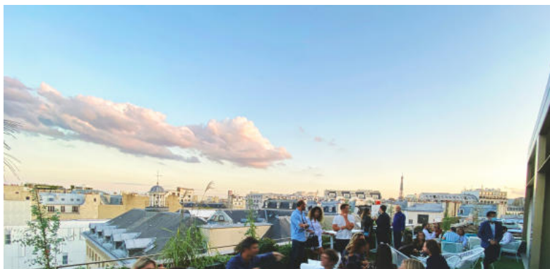
Pley hôtel, roof top

En s'associant avec le vignoble familial du Château de Pampelonne , le Rooftop du