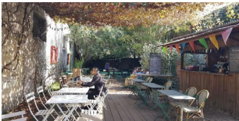
Le Bar de la Marine, Bordeaux