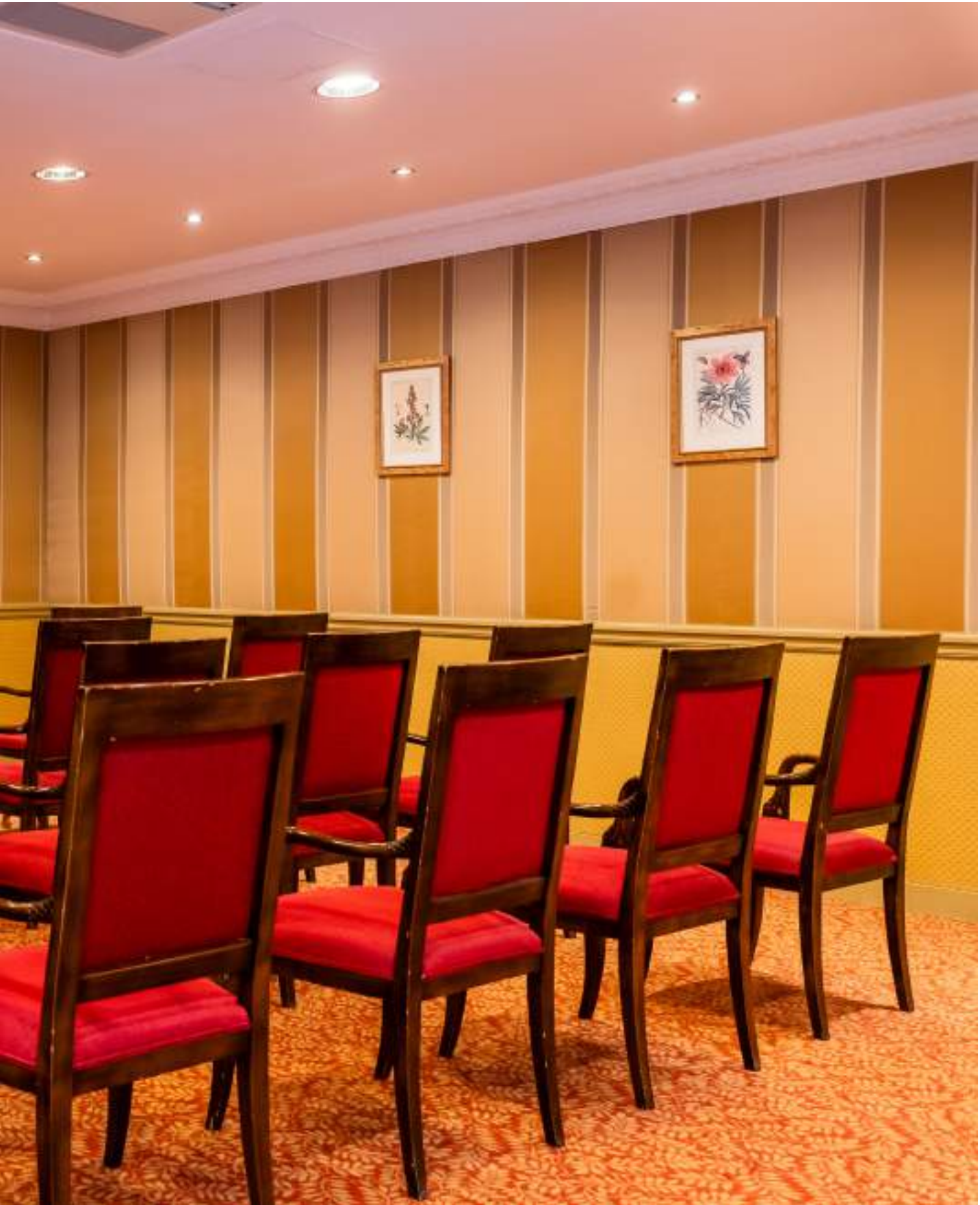
CONFIGURATION : THÉÂTRE 35 PLACES