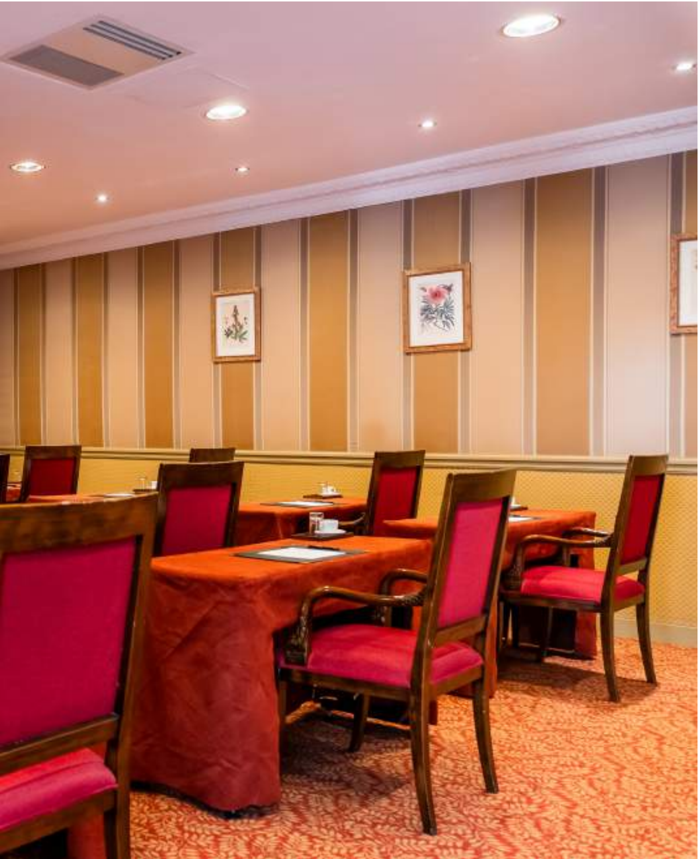
CONFIGURATION : CLASSE 20 PLACES