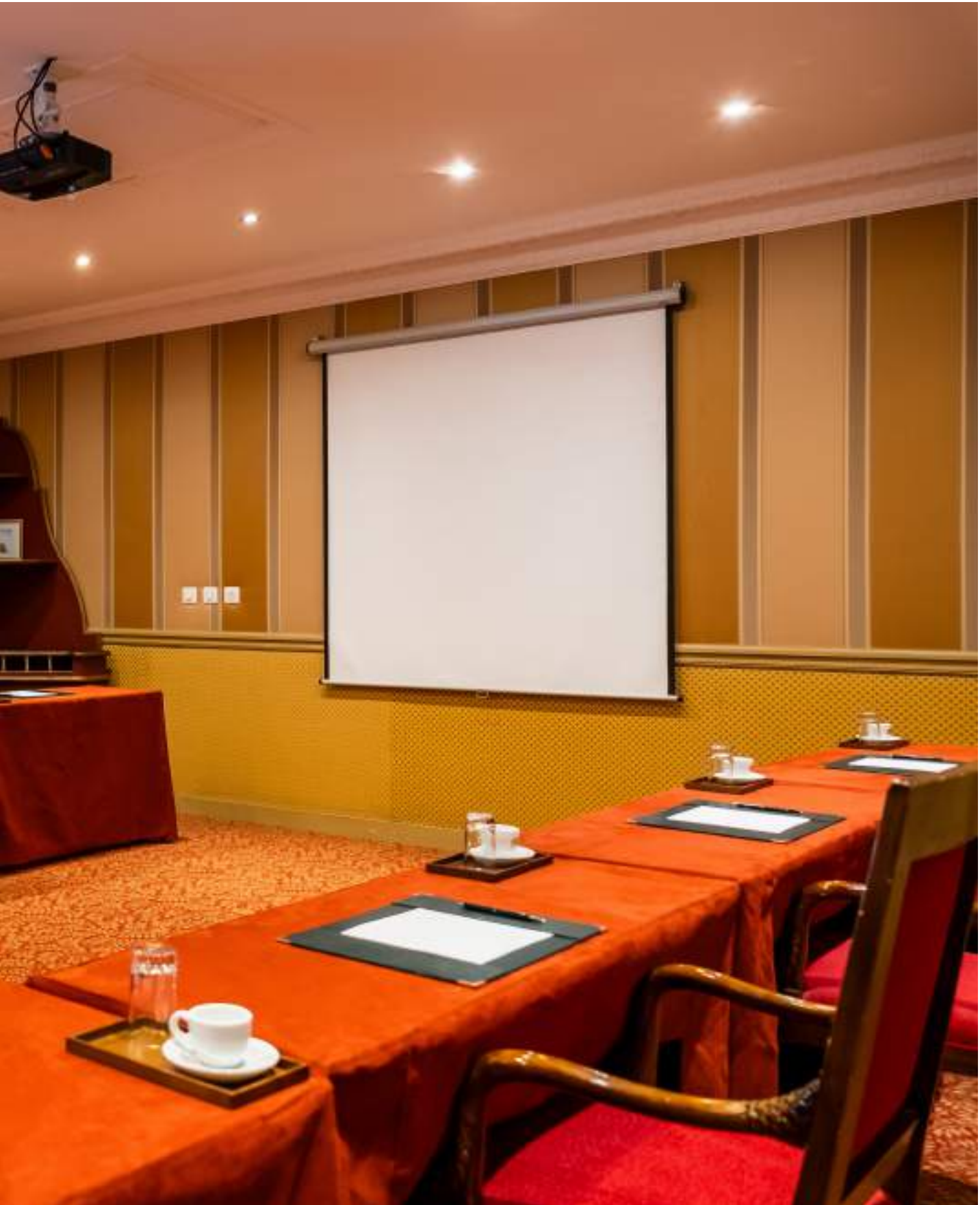
CONFIGURATION : U 22 PLACES