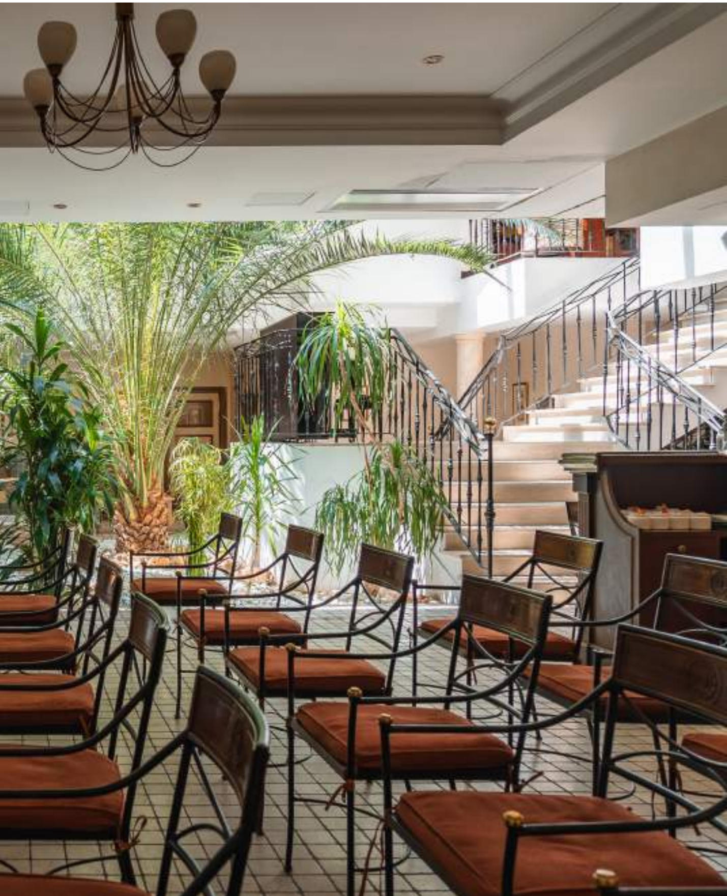
CONFIGURATION : CLASSE 25 PLACES