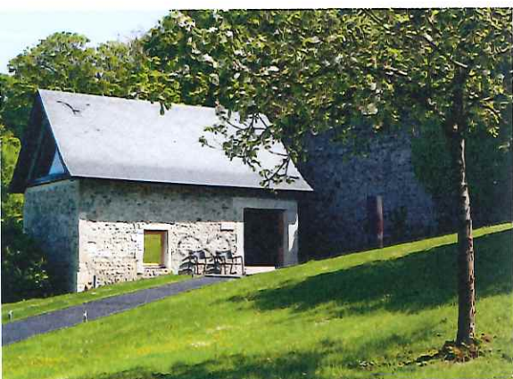
Un appartement-maison, ancienne bergerie de 45 m 2 avec sa terrasse privée, quand on a envie de s'isoler.

Route du Littoral / F-14600 Honfleur T +33 (0)2 31 81 63 20