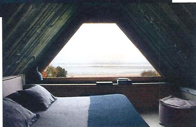
Literie en coton biologique, matériaux nobles, textiles chaleureux et teintes naturelles, tout concourt à la sérénité.

Entre mer et jardin, une Chaumière romantique où il fait bon se ressourcer et flâner. Belle initiative, une nouvelle possibilité est offerte depuis peu sur le même site: une magnifique Maison d'Hôtes baptisée le Manoir de la Plage propose dorénavant six chambres chic, cosy et spacieuses dans un environnement préservé. On peut ainsi profiter de tous les équipements de La Chaumière.