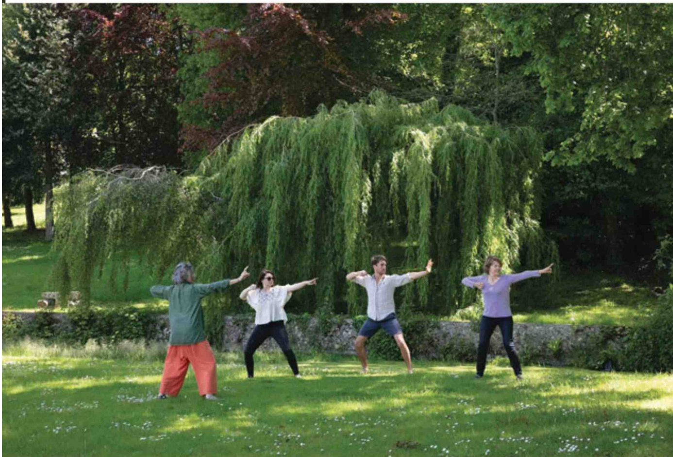
Les sportifs pourront profiter du terrain de tennis face à la mer, jouer à la pétanque ou bien louer un canoë kayak pour aller à la découverte de l'estuaire. Cocooning : massages ayurvédiques, madala du ventre, Abhyanga et cours de Qi Gong ponctuels. S'y ajoutent une salle de sport Technogym avec un sauna infrarouge, des tables de massage et une salle de yoga.