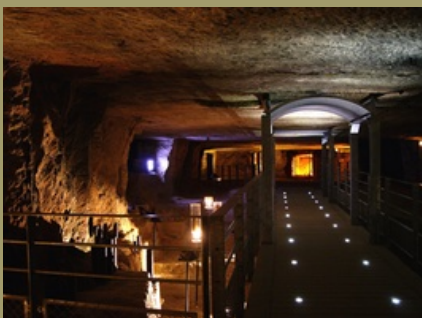
La caserne du Dragon