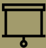
Ecran de projection