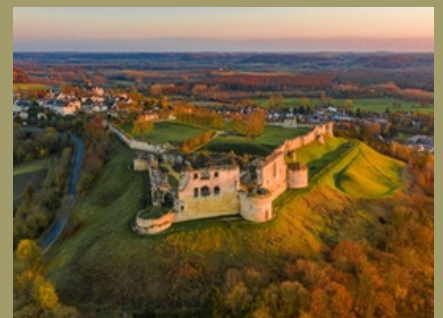
Coucy le Château