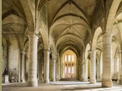
L'Abbaye Saint Léger