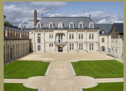
La Cité Internationale de la Langue Française