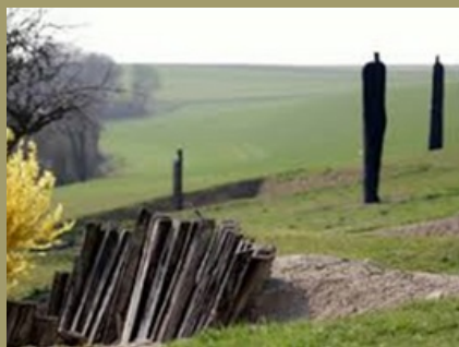
Le chemin des Dames