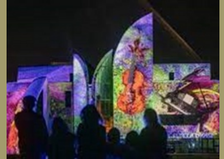
Soissons En Lumière