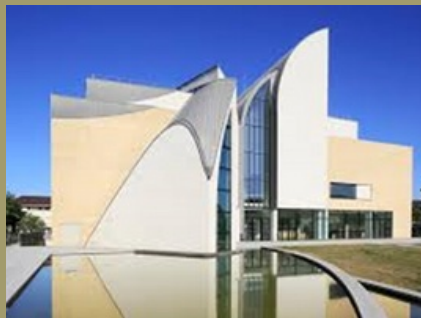
La Cité de la Musique et de la Danse