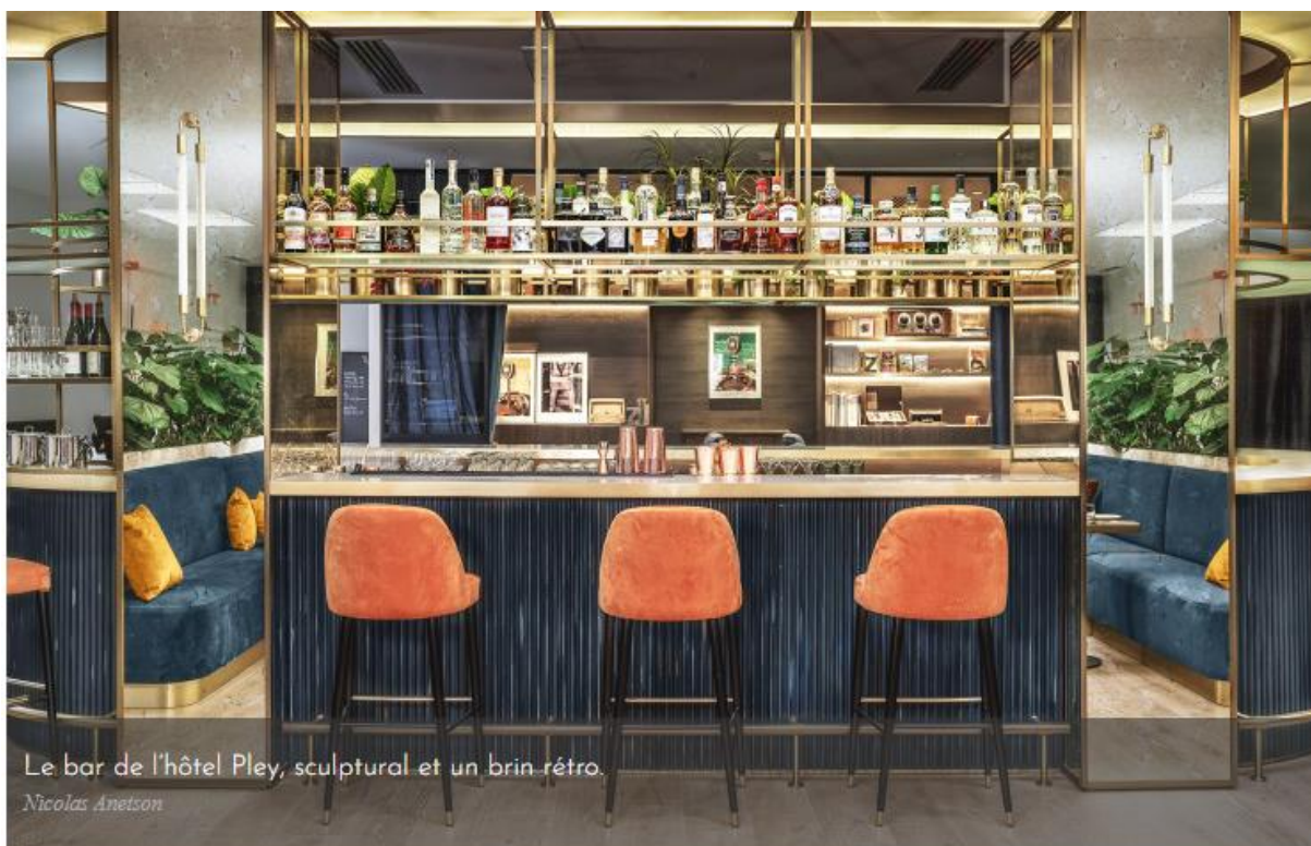
Le bar de l'hôtel Pley, sculptural et un brin rétro.