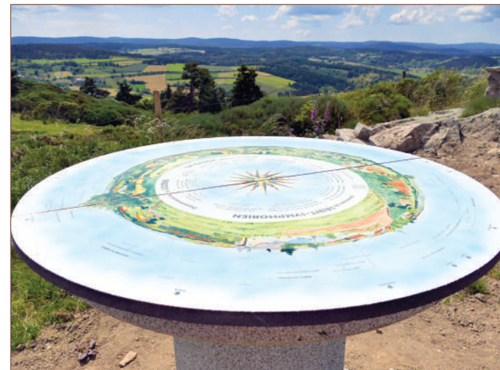
Point de vue depuis la table d'orientation