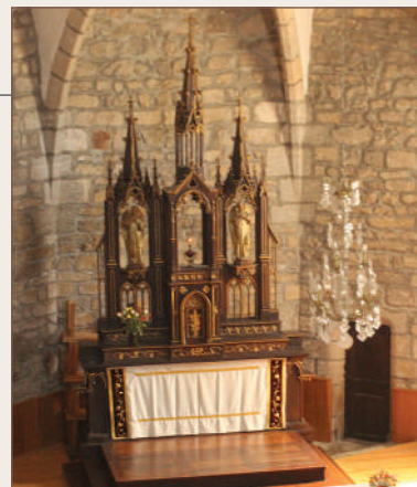
Retable de l'église

Àu XII e siècle, la paroisse dépendait des moines de La Chaise-Dieu. Au XVIII e siècle, le Conseil général de l'Administration départementale de Lozère lui donna le nom de « Bel Air », notamment pour son aspect perché, sur les hauteurs. En 1837, une partie du territoire communal est cédée pour la création de la commune de Chambon-le-Château (qui le deviendra en 1896), ce qui représenta une perte de population de 415 habitants.