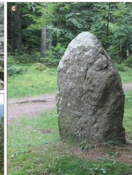
A Rocher des Fées / B Panorama / C Menhir