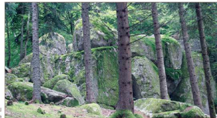
Chaos granitique du Ron de la Baoume

• Comité Lozère : www.randonnee-lozere.fr