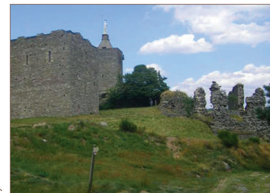
Les ruines du château de Luc

• Comité Lozère : www.comitedepartementaldelarandon-nepedestredelozerecdrp48.com