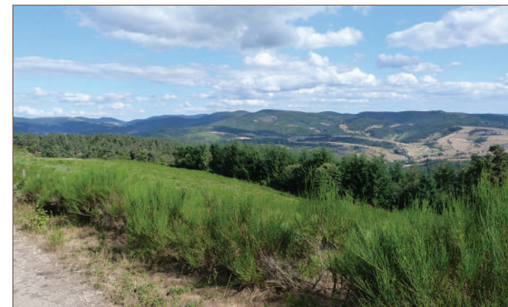
Point de vue sur le Circuit du château