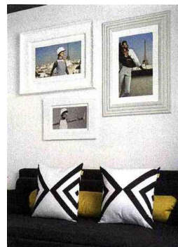
Suite page 91 Un canapé Dorelan.

tel. Dans les chambres, la griffe Nuel, tout en élégance et en simplicité, est partout présente avec les têtes de lit sur-piquées, les salles de bains ouvertes sur la chambre, le mobilier en noir et blanc,