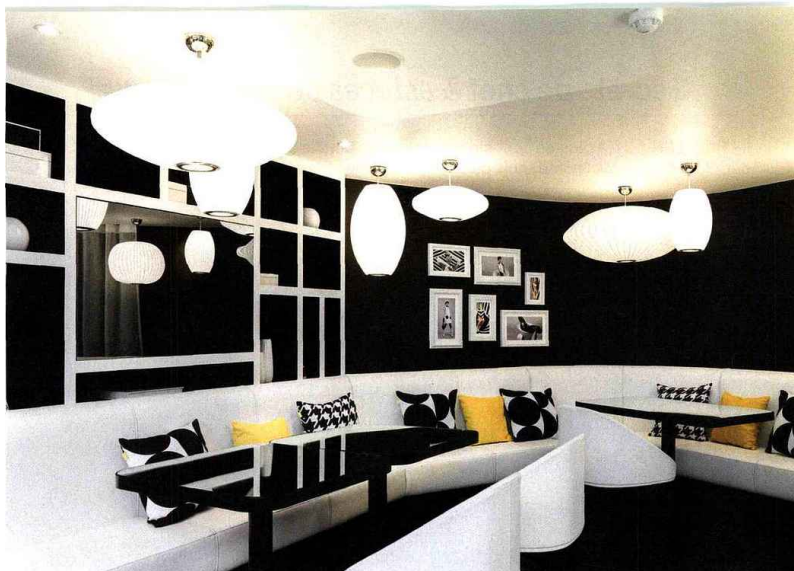
La salle de petit déjeuner.