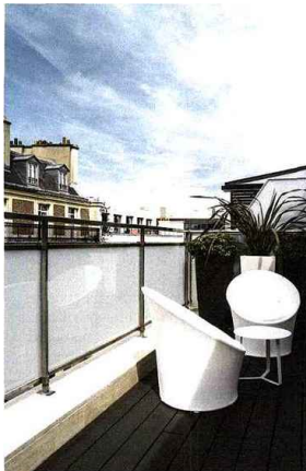
Certaines chambres disposent d'une terrasse.