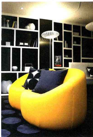
Sofas Pumpkins de Pierre Paulin.