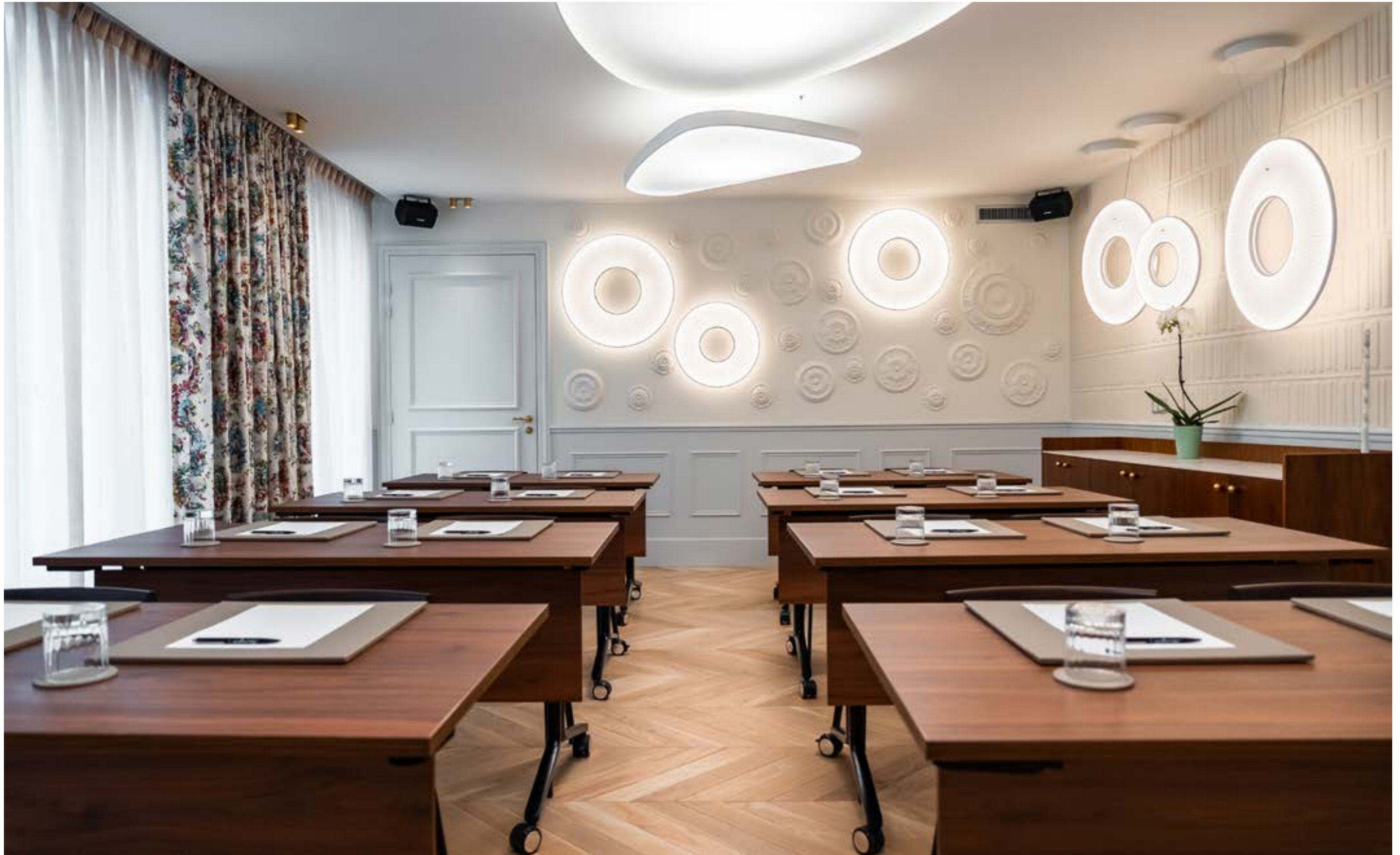
CONFIGURATION: CLASSROOM SEATS: 20