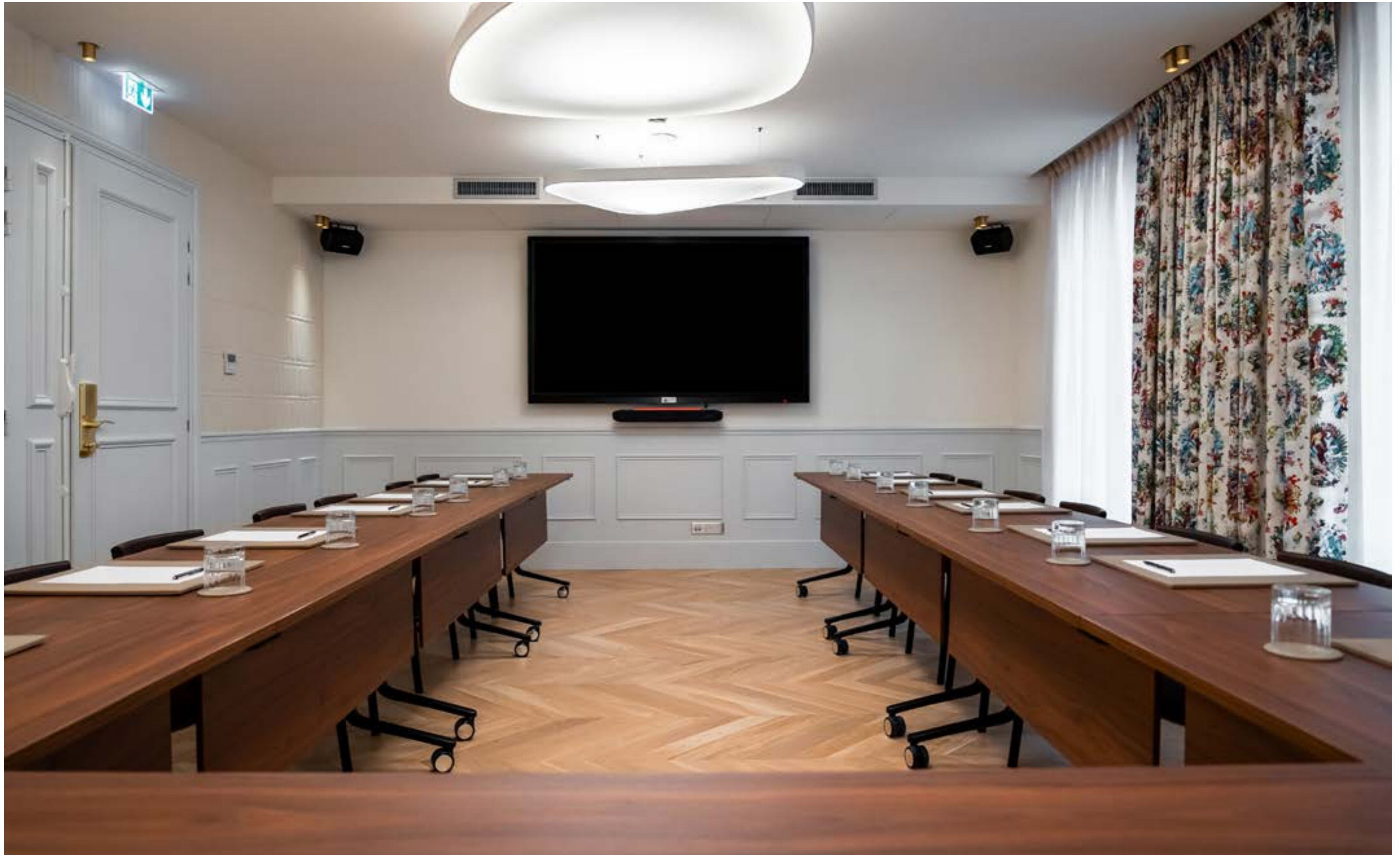
CONFIGURATION: U-SHAPE, SMALL U-SHAPE, DOUBLE U-SHAPE SEATS: 20-24-32