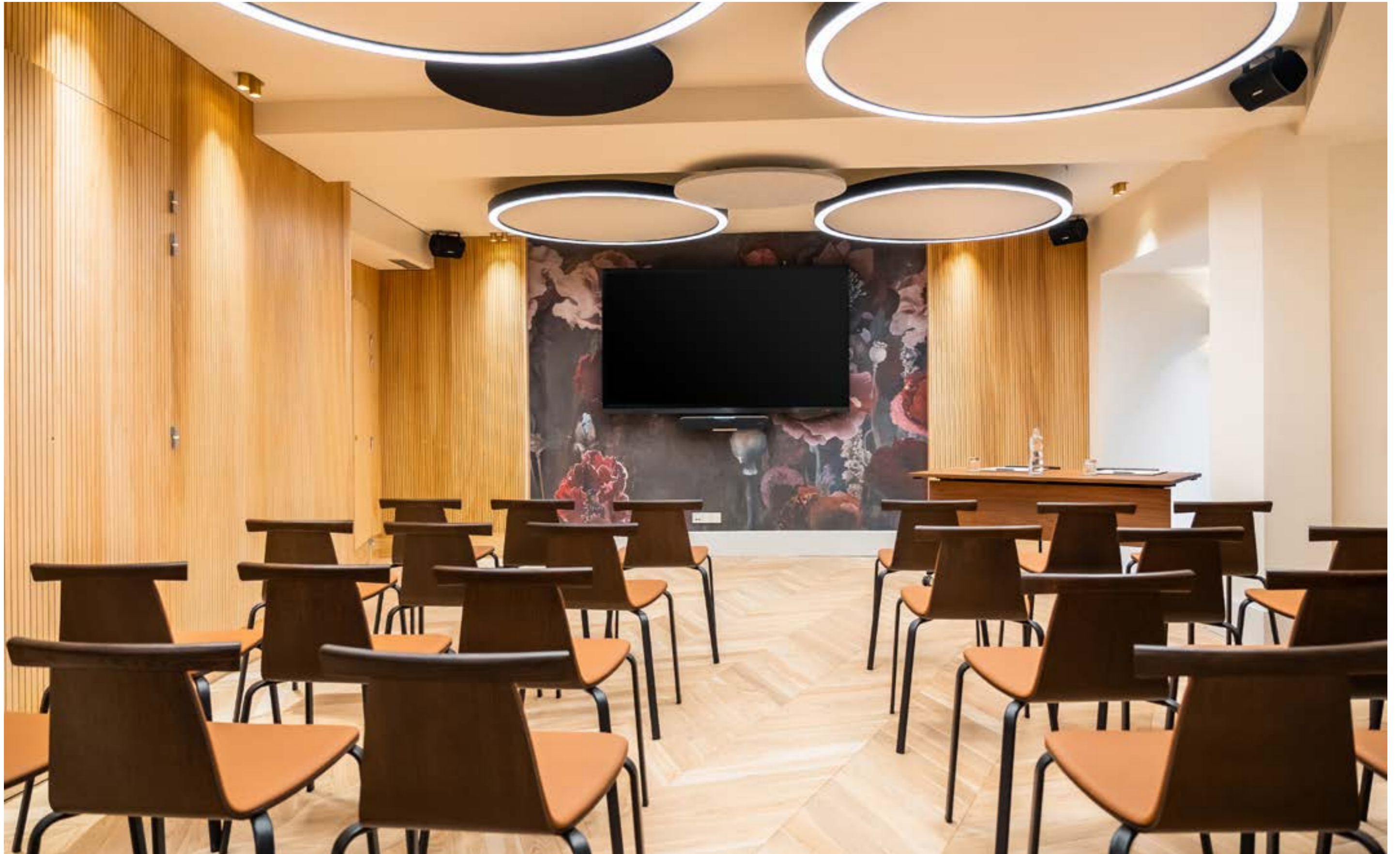
CONFIGURATION: THEATRE SEATS: 60