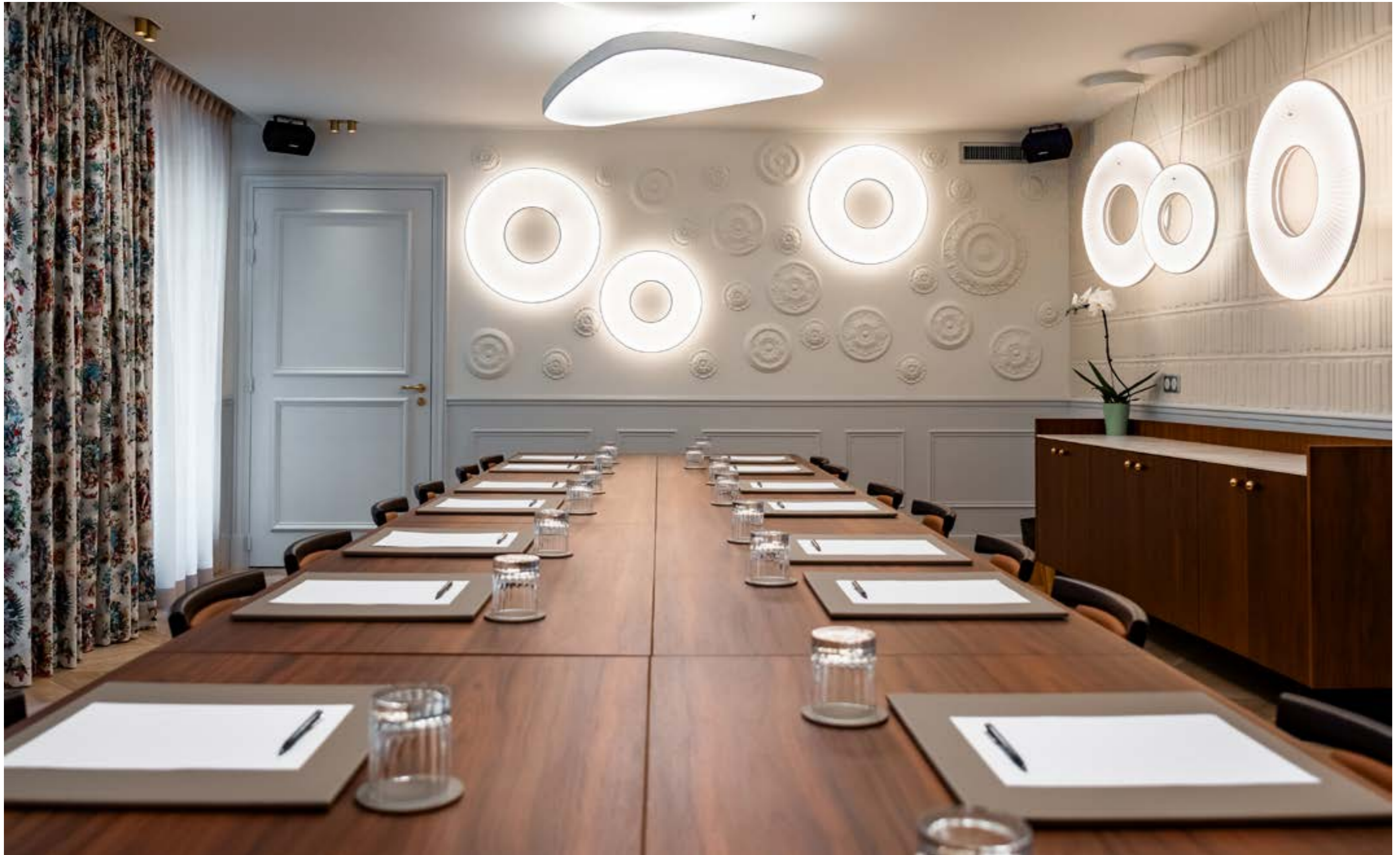
CONFIGURATION: BOARDROOM SEATS: 18-24