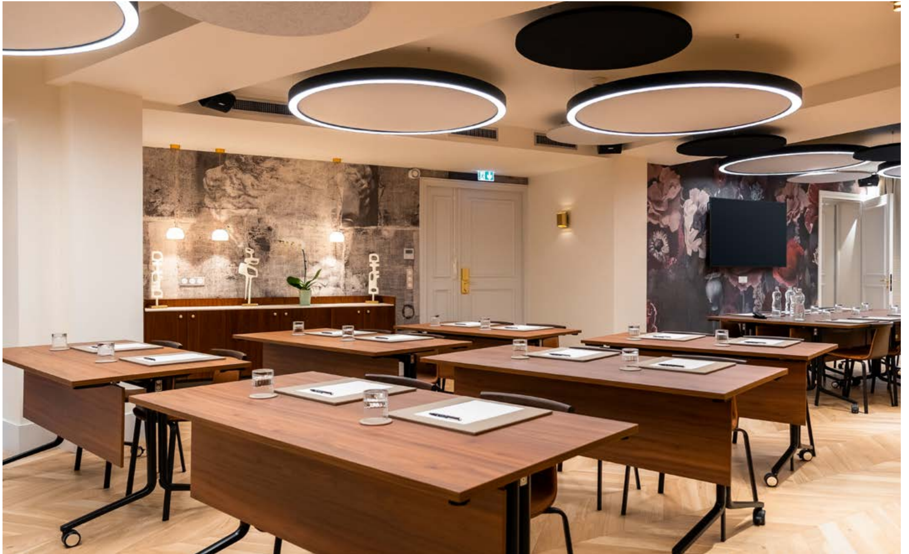
CONFIGURATION: CLASSROOM SEATS: 28