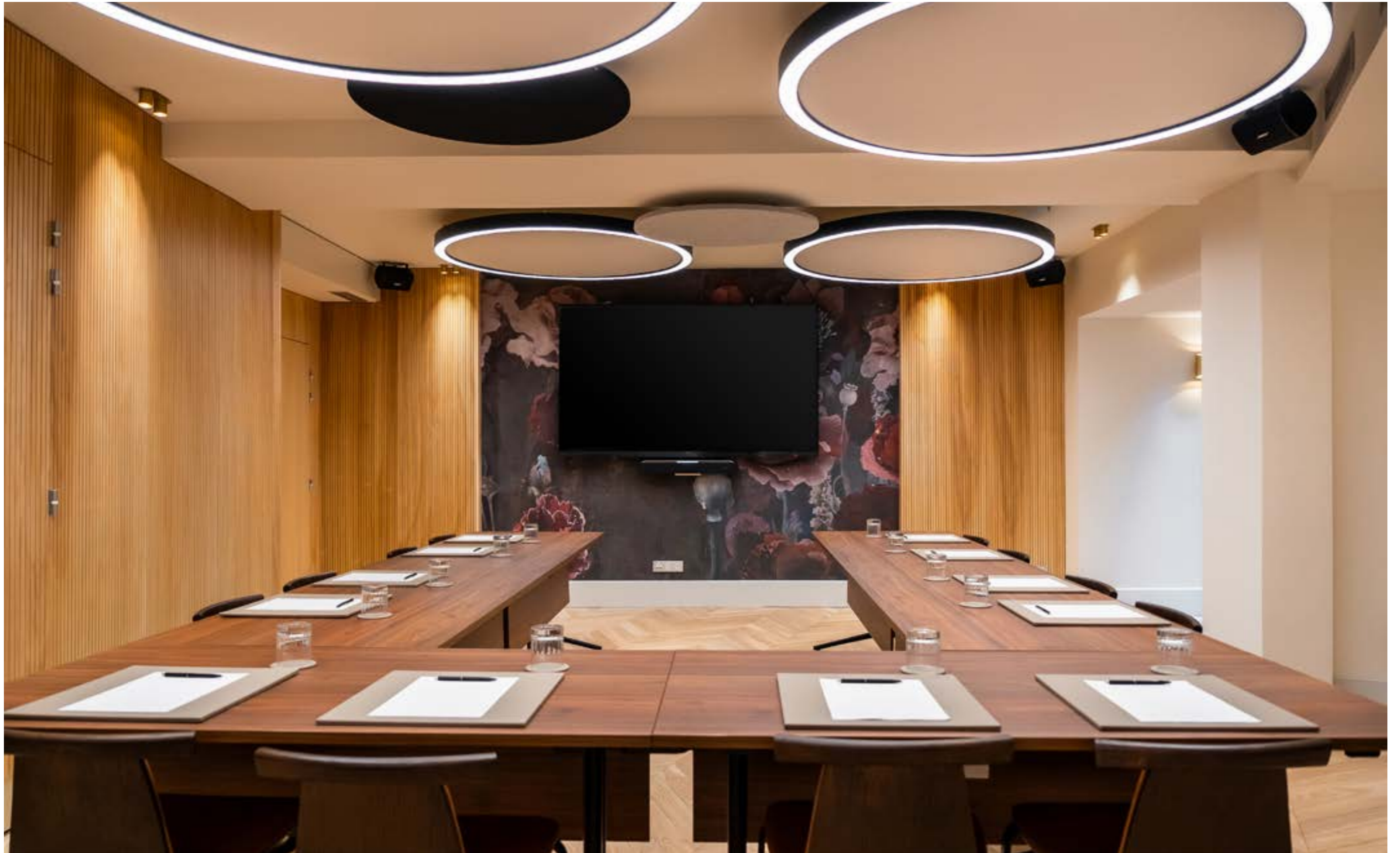
CONFIGURATION: U-SHAPE, SEATS: 20