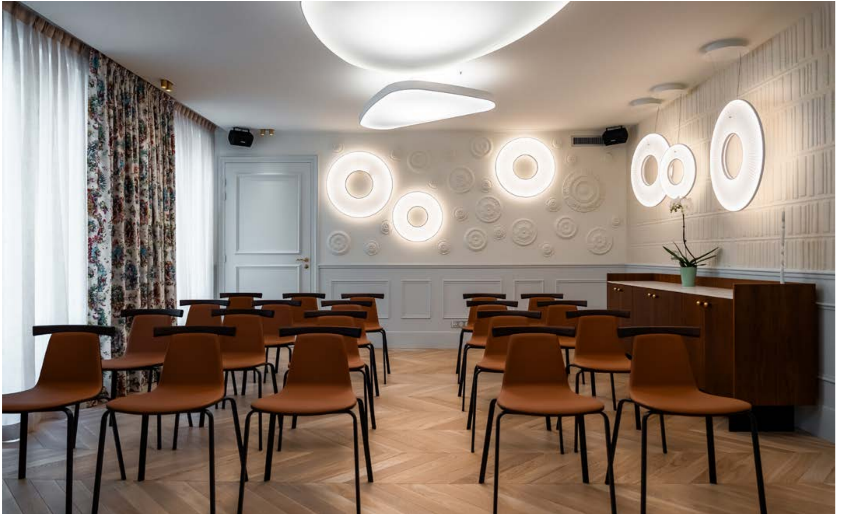
CONFIGURATION: THEATRE SEATS: 42