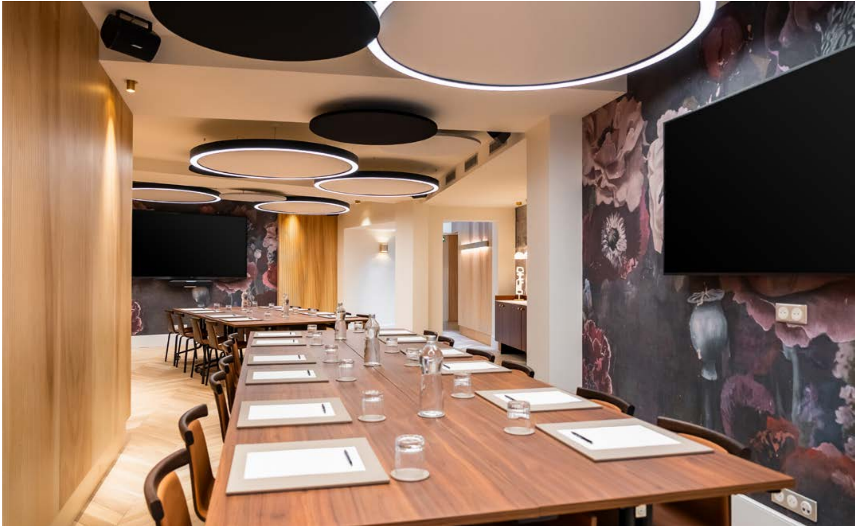
CONFIGURATION: BOARDROOM SEATS: 36