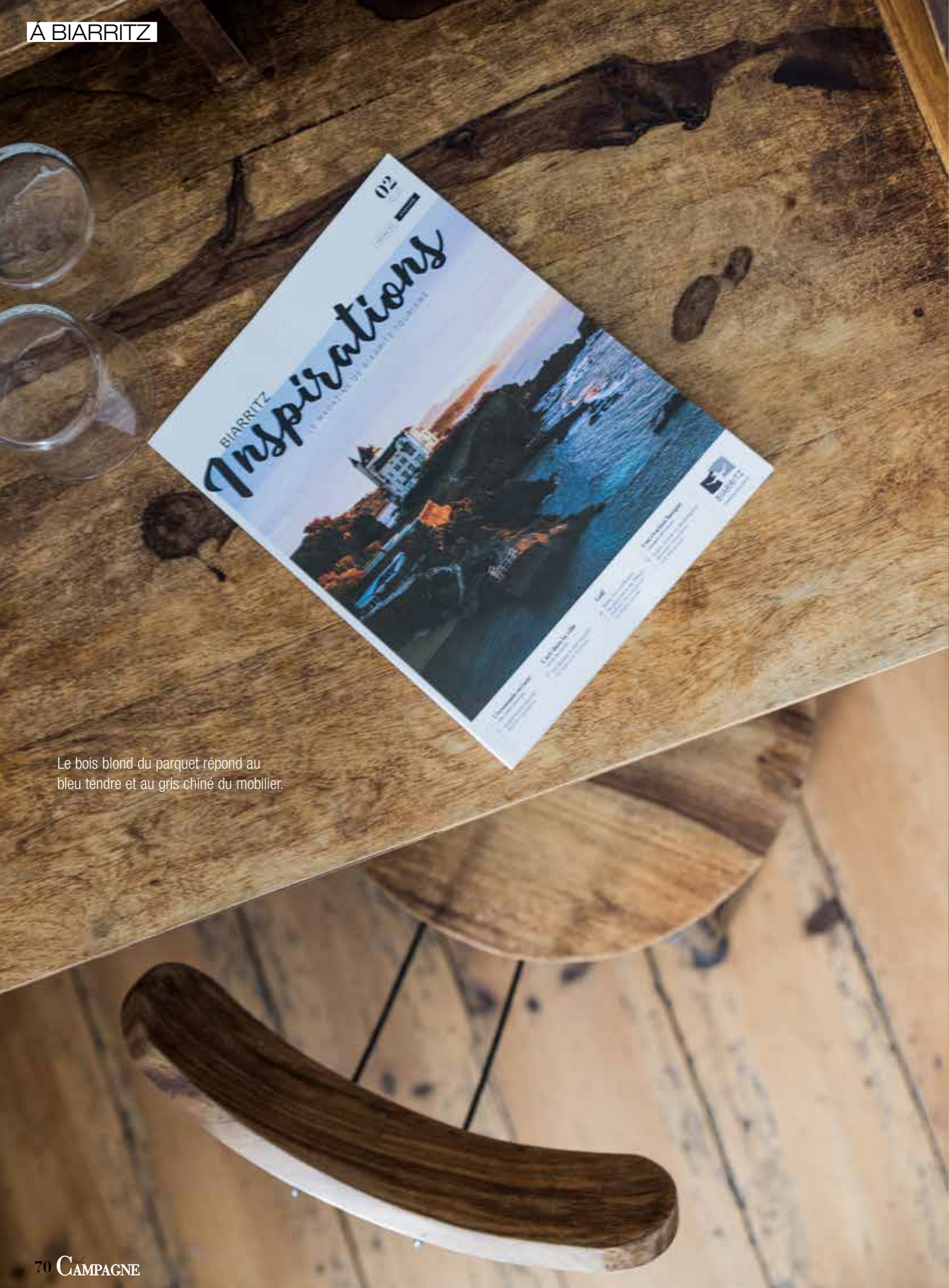
Le bois blond du parquet répond au bleu tendre et au gris chiné du mobilier.

Entre bois, raphia et osier, le petit salon fait la part belle au mobilier sur mesure et aux matériaux naturels. Côté décoration, le raphia s'incarne sur le mur en 3 dimensions ! Façonné avec créativité, il vient orner le papier peint tissé de quelques rosaces qui semblent défier la gravité. De discrètes suspensions éclairent le beige rosé de tables et de chaises agencées pour quelques instants d'intimité.