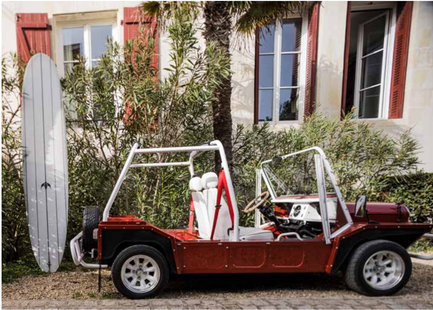
Un lieu de vie dans l'air du temps et un pied à terre élégamment stylé pour parenthèse privilégiée.