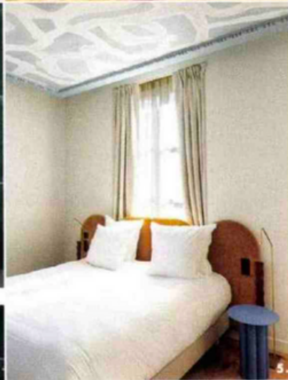
1. La salle du petit-déjeuner convoque les couleurs de la Méditerranée avec ses panneaux aux allures d'aquarelle, de référence « Calypso » chez Asteré. 2. Côté petit salon, le mur décoratif fait jouer la fibre « Raphia Rosace » de chez CMO. 3. 4. Avec une modernité à l'air local, le relooking a associé l'agence d'architecture intérieure Crème, basée à Bordeaux, et l'agence RoseDesign, à Biarritz. 5. Parmi les six nouveaux écrans, la chambre bleue doit son nom au papier « Tangled », chez Asteré encore.

Derrière ses volets rouges non moins typiques, l'éternelle façade blanche de l'hôtel Saint-Julien, à Biarritz, remet les pendules à la bonne heure. En complément des 21 chambres grimant jusqu'au troisième étage, dont certaines avec vue sur le phare ou l'océan, six nouvelles venues ont pris leurs aises en rez-de-jardin, agrémentées chacune d'un espace extérieur privatif. Palette douce, dont le bleu tendre et le gris chiné du mobilier répondent au blond du parquet, pendant que les tentures sable s'harmonisent avec la pierre de l'extérieur. Luminaires dans le vent aussi qualitatifs que la literie siglée Tréca, marque assise de longue date dans les plus grands hôtels du monde entier. Panoramique à la géométrie poétique au plafond, dont la modernité se conjugue aux arches arrondies des portes et aux moulures d'origine. Loin de ces écrans new look , cette décoration aussi contemporaine qu'intemporelle infuse son esthétique forte à toutes les parties communes. Dès l'entrée, le papier peint « Kintsugi » déploie sa collaboration entre un artiste et l'éditeur Elitis, parmi les autres motifs de cette collection commercialisée sous le nom Asteré; en miroir à cette fresque veinée