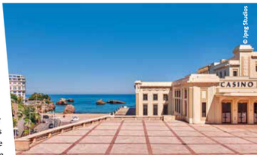
Le Casino Municipal

Un vent de fraîcheur souffle sur le parc hôtelier biarrot au rythme des rénovations en cours : l'emblématique Régina Biarritz Hôtel & Spa 5* (72 chambres), repris par Experimental Group, se refait une beauté pour rouvrir à l'été prochain quand, tout à côté, a ouvert Le Garage 4* (27 chambres) à la déco épurée, du même groupe (espace restaurant et bar, piscine extérieure cernée d'un beau jardin) ; le Mercure Centre Plaza 4* rouvrira fin mars après une totale réhabilitation et l'hôtel Saint-Julien 3* , racheté par le groupe Ginto, revoit et consolide son offre (6 chambres supplémentaires aux 20 existantes, réagencement des espaces communs) pour rouvrir en mai prochain. Achievées, d'autres rénovations ont permis à l'offre de monter en gamme. En juillet 2022, a rouvert sur la plage du Port-Vieux l' Hôtel de la Plage entièrement reconstruit pour se muer en un boutique-hôtel 4* cosy de 20 chambres, au style chic, épuré et naturel (salon, épicerie, rooftop avec bar). Puis, l' Hôtel du Café de Paris 4* a vu ses 19 chambres, toutes vue océan, revues par Sarah Lavoine comme son restaurant (110-120 places) dont la carte est signée par le chef étoilé Cédric Béchade. Au Grand Tonic Hôtel & Spa 4* (65 chambres, salle de 30 places), a ouvert en 2022 un spa Nuxe tandis que les chambres, spacieuses, et le restaurant très Art déco (100 personnes), se sont vues modernisées. À deux pas