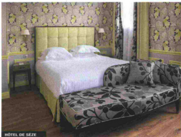
HÔTEL DE SÈZE